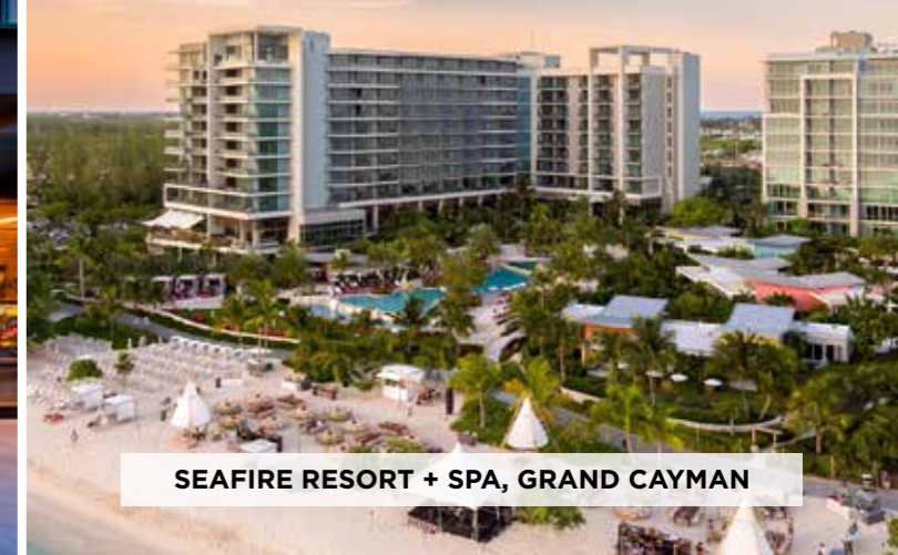
SEAFIRE RESORT + SPA, GRAND CAYMAN