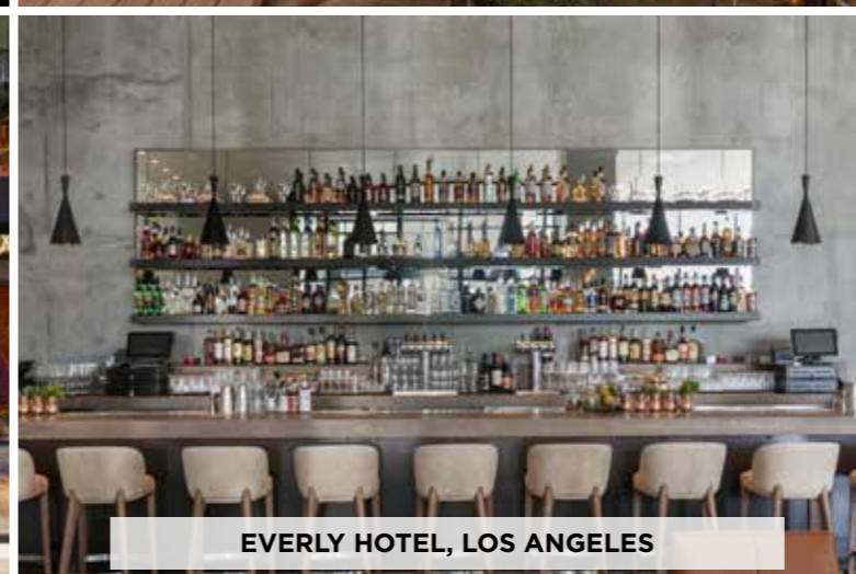
EVERLY HOTEL, LOS ANGELES