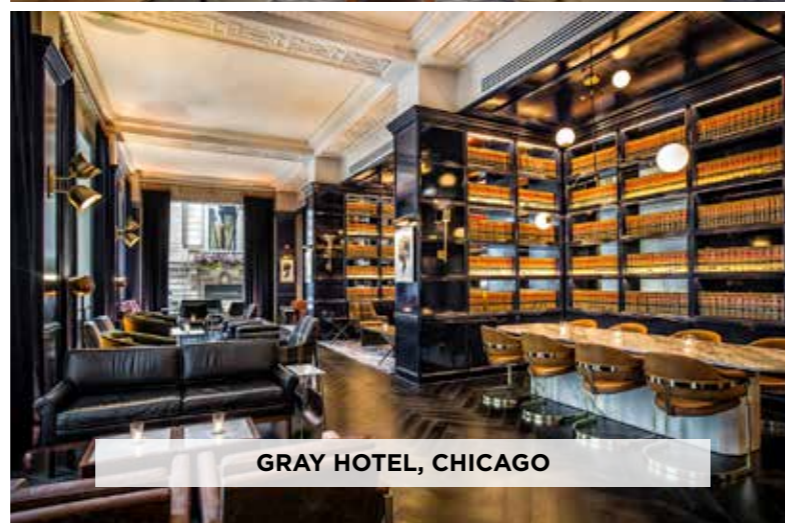
GRAY HOTEL, CHICAGO