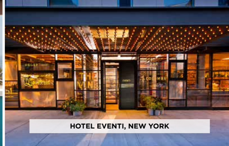
HOTEL EVENTI, NEW YORK