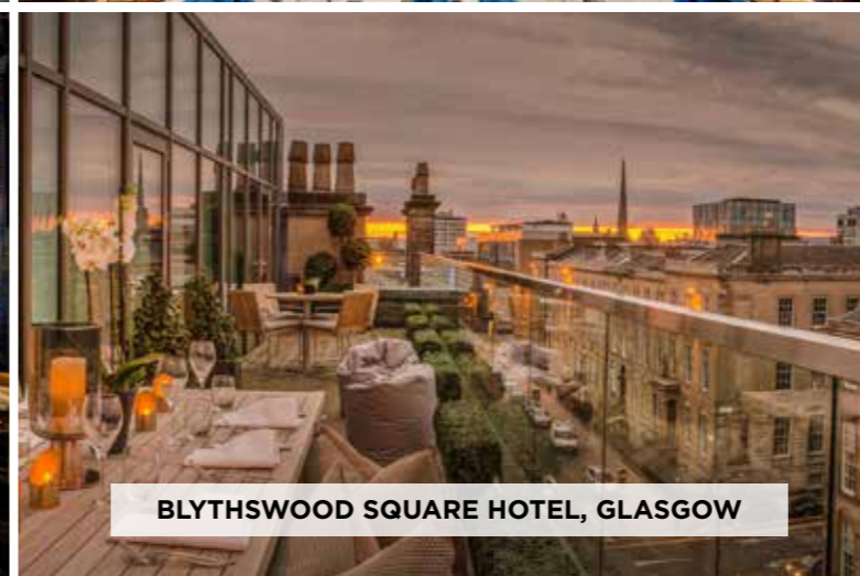
BLYTHSWOOD SQUARE HOTEL, GLASGOW