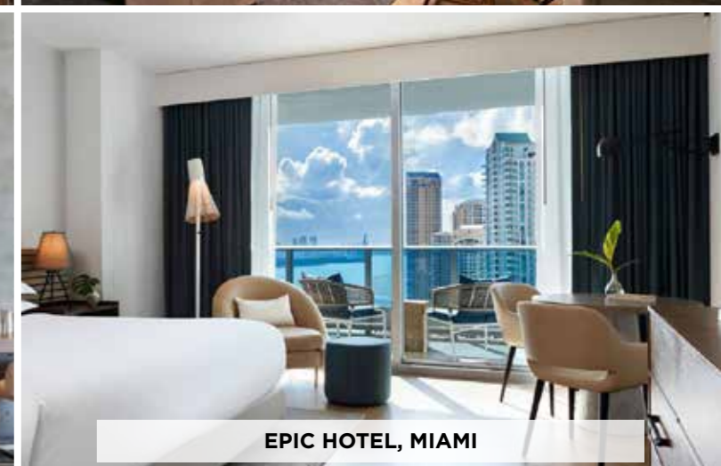
EPIC HOTEL, MIAMI