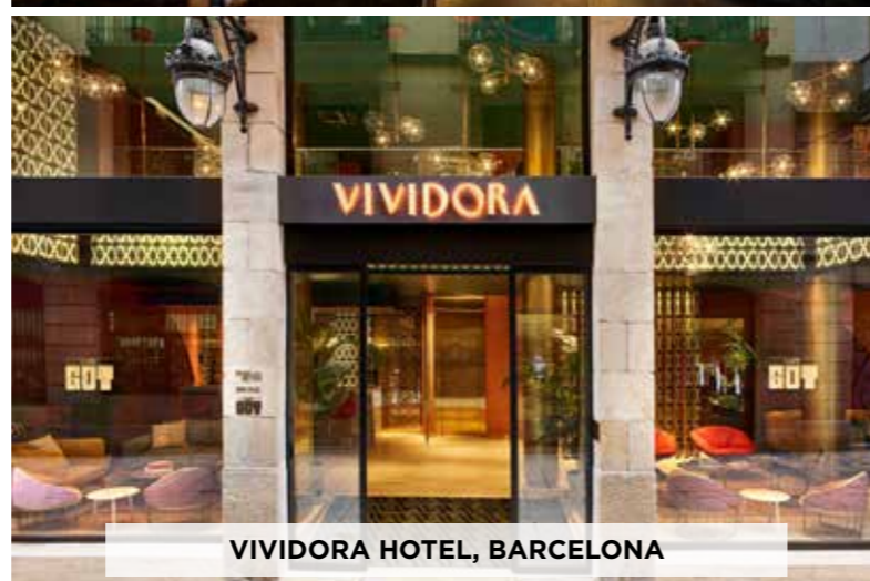
VIVIDORA HOTEL, BARCELONA