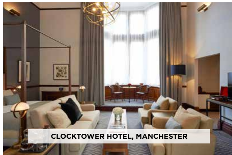
CLOCKTOWER HOTEL, MANCHESTER