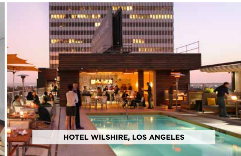
HOTEL WILSHIRE, LOS ANGELES