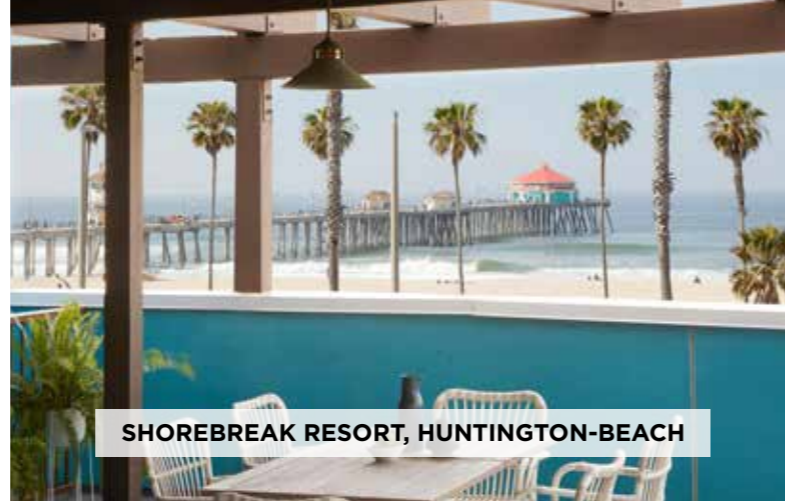
SHOREBREAK RESORT, HUNTINGTON-BEACH

IHG ® là một trong những công ty kinh doanh khách sạn hàng đầu thế giới với hơn 5.700 khách sạn trên toàn cầu tại gần 100 quốc gia. Phạm vi và quy mô của IHG ® sẽ cho phép Kimpton Kawana Bay tận dụng các kênh phân phối mạnh mẽ thông qua các nền tảng và mạng lưới đại lý đẳng cấp thế giới của IHG.