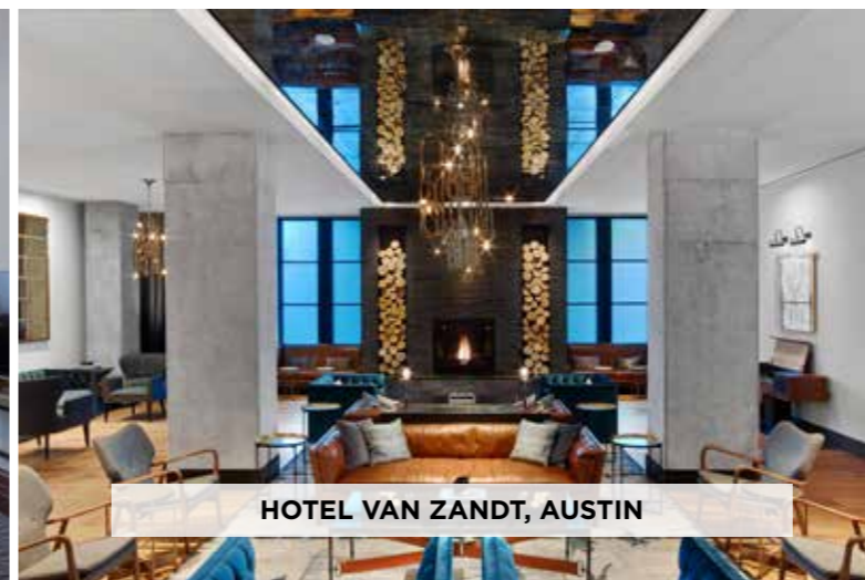
HOTEL VAN ZANDT, AUSTIN